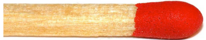
La nymphe de tique, plus petite que la tête d'une allumette est responsable de 75% des borrelioses

L'étude des sous populations lymphocytaires permet de mesurer le rapport des NK CD57+ / NK CD56+. Bien que ce test ne soit pas spécifique de la borreliose, un résultat inférieur à la normale (0,35 à 0,75) est souvent corrélié à une atteinte chronique.