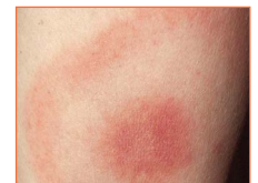
EM caractéristique du Lyme

L'érythème migrant (EM) est la manifestation la plus fréquente (40 à 77 %) et la plus évocatrice. Il apparaît dans un délai variant de quelques jours à plusieurs semaines au site de la piqûre. Un délai < 24 h est en faveur d'une réaction non spécifique. L'aspect clinique initial est une macule érythémateuse à croissance de quelques mm/jour de forme annulaire et centrifuge.